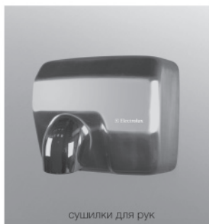
СУШИЛКИ ДЛЯ РУК