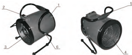
Рис. 1 Тепловентилятор

5.1 Схема тепловентилятора представлена на рис. 1.