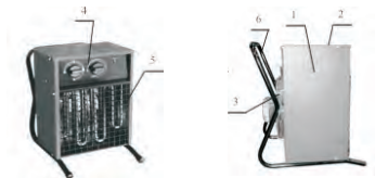
Рис. 1 Тепловентилятор

5.1 Схема тепловентилятора представлена на рис. 1.