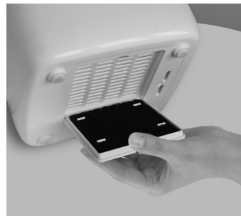
Рис. 9 Фильтр очистки воздуха Pre-filter

Воздух может содержать в себе различные примеси, которые могут при дыхании попадать в дыхательные пути человека или оседать в приборах. Фильтр очищает воздух от крупных фрагментов пыли, шерсти и защищает внутреннюю часть прибора и комплектующие от пыли и прочих примесей.