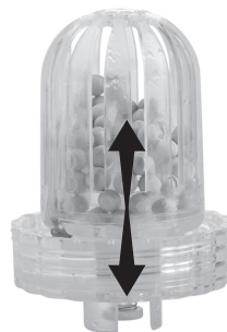
Рис. 6 Фильтр-картридж FC-190

В комплект прибора входит фильтр с ионообменной смоллой. При длительном использовании увлажнителя без замены фильтра на приборе и на предметах рядом с ним может появиться белый осадок.